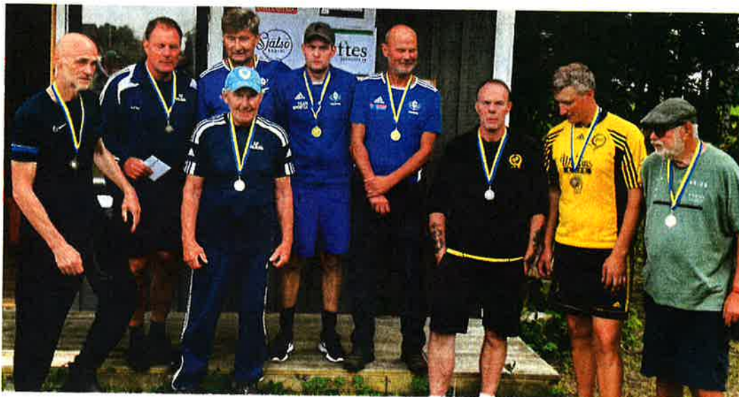
Väs kinase AIS, gotlandsmästare i stenvarpa