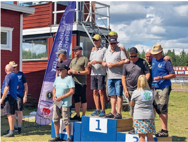
SM Gräs, Stavnäs, Ingmår, Mora.