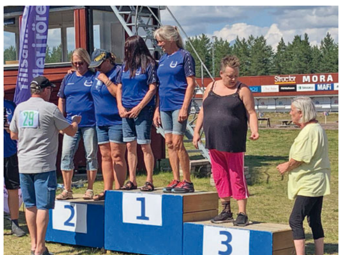
SM Gräs, Mora2, Mora1, Stavnäs.